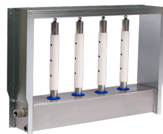
MODÈLE MP ULTRA-SORB Coûts d'installation les plus réduits