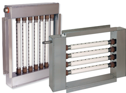
MODÈLE LV/LH ULTRA-SORB Capacité et polyvalence inégalées